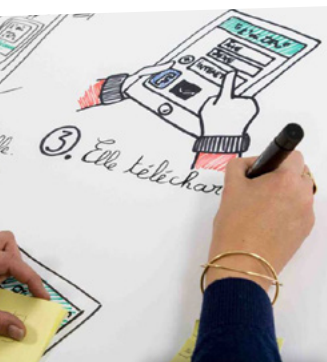
Design de services