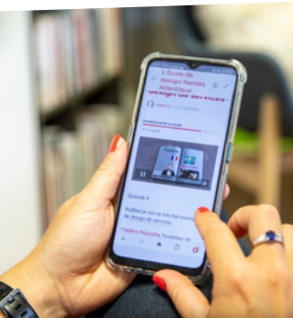
E-learning Design Thinking

› 4 jours pour appréhender la démarche de Design Thinking, déboucher vers des solutions plus innovantes ou en rupture avec l'offre existante.